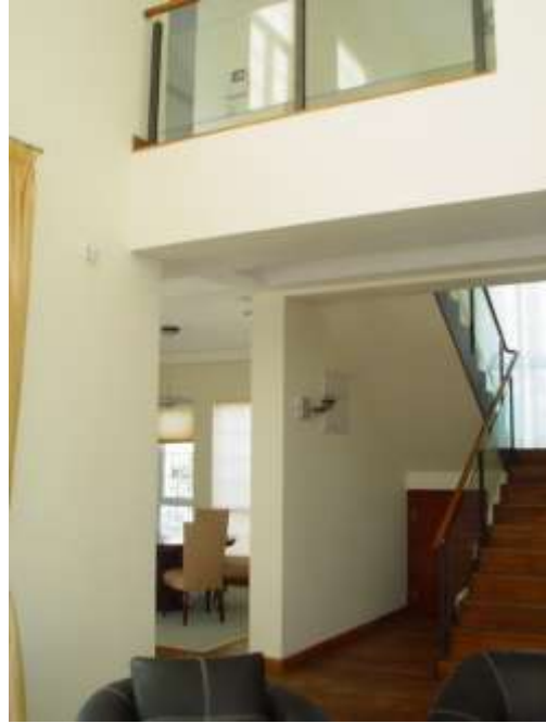
樓下之客廳, 飯餐廳之連接區及上樓之樓梯