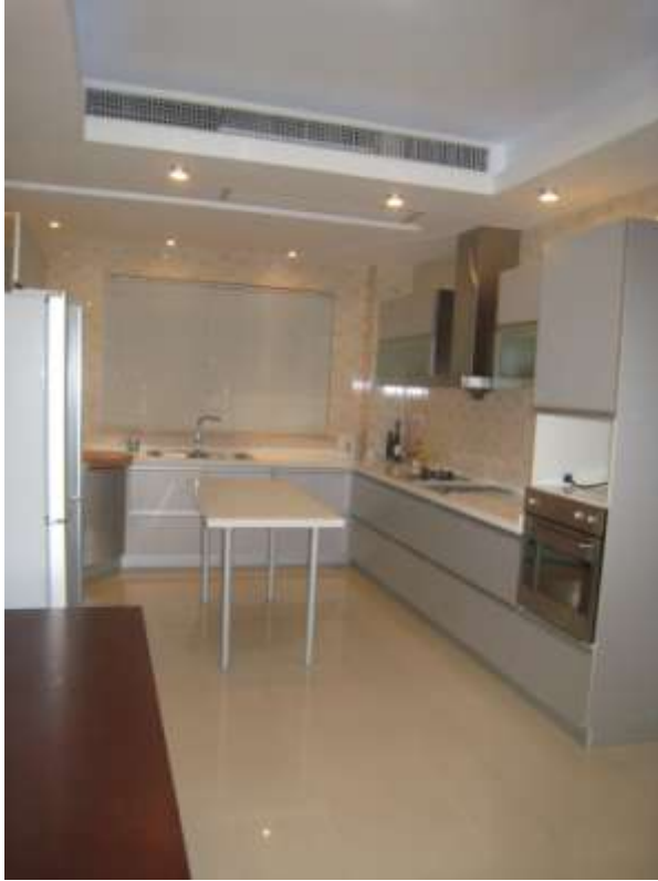
廚房之右面，右門入洗衣房及傭人起居住所