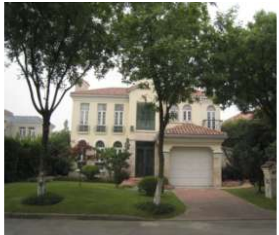
87 號之前花園與停車場