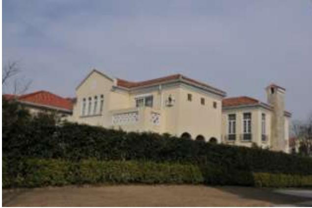
從湖岸觀看樓王一期 87 號屋之東側面及中庭園