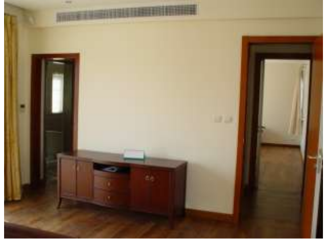
主臥室, 右向次臥室, 左入主人洗手間及衣帽間