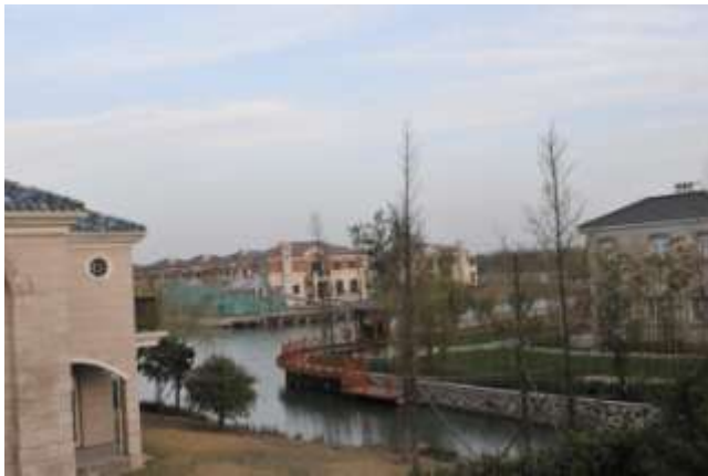
後向南花園上之露台觀看湖景