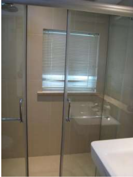
客臥室洗手沐浴坐廁室