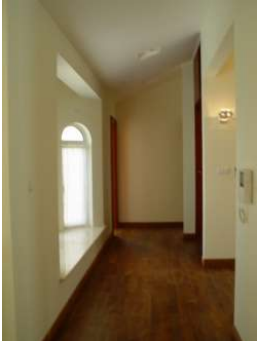
一樓之走廊，右邊開放式書房