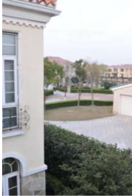
向東之窗戶看一期湖中之小島