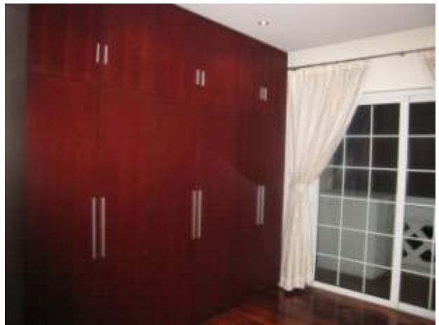
次臥室衣櫃及向南陽台