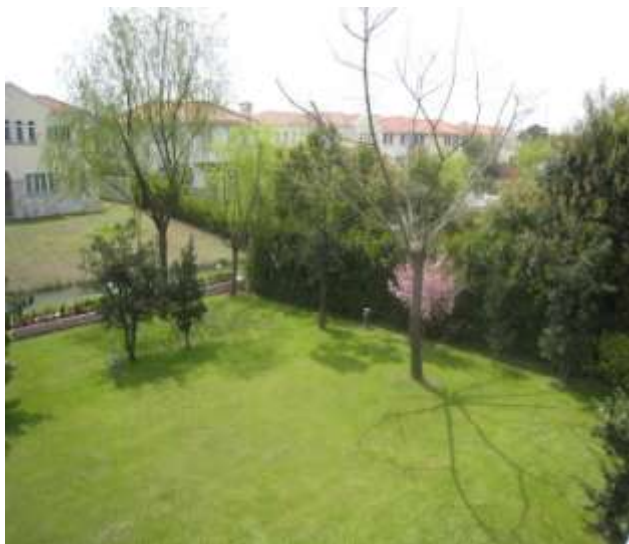
從露台向內河看的一景