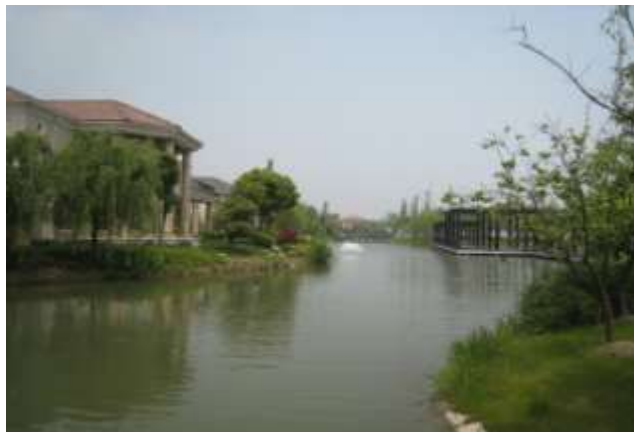
中海翡翠湖岸之中心湖岸,容積率低於 0.24

中海翡翠湖岸整區之最佳中心區·以黃圈之一期#86 號及#87 號為湖景中心最清靜的兩幢別墅。