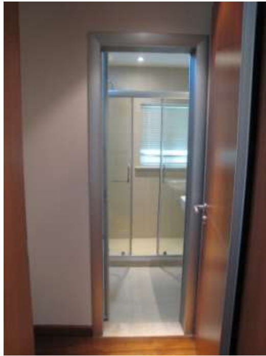
客臥室洗手沐浴坐廁