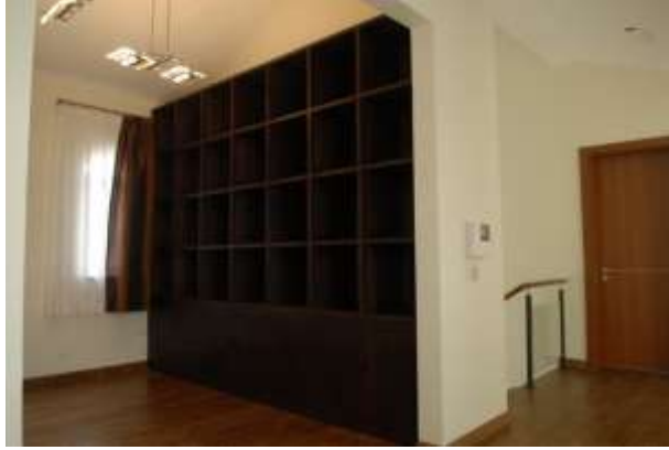
開放式書房文化工作間