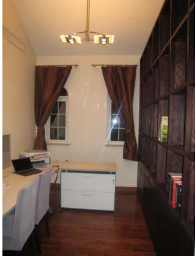
書房工作間之電腦工作桌及老榆木書架