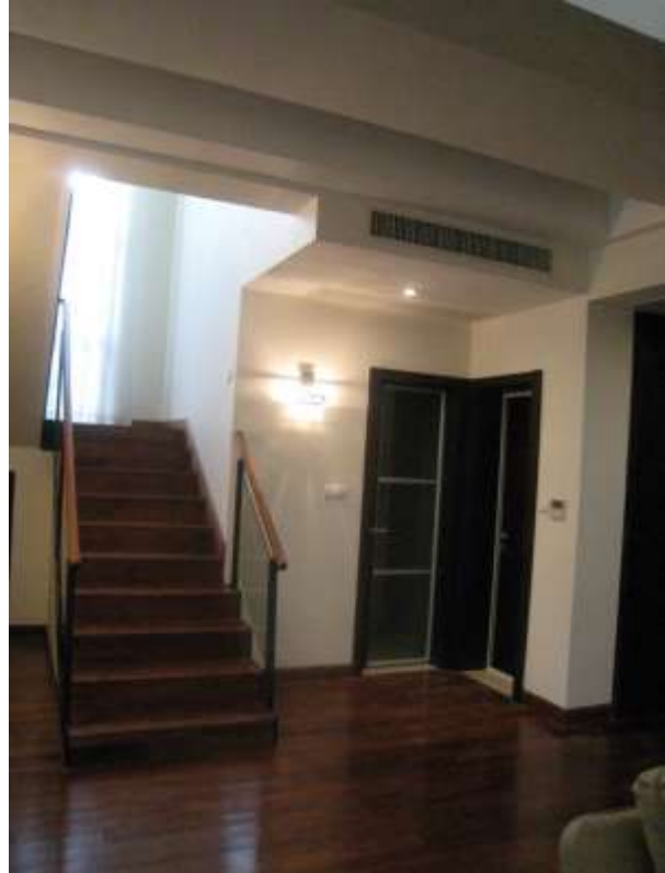
上一樓之柚木樓梯, 右邊是洗手間, 車庫