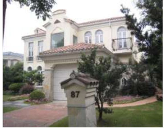
87 號屋之前院，車房左鄰地，可停車 6 部