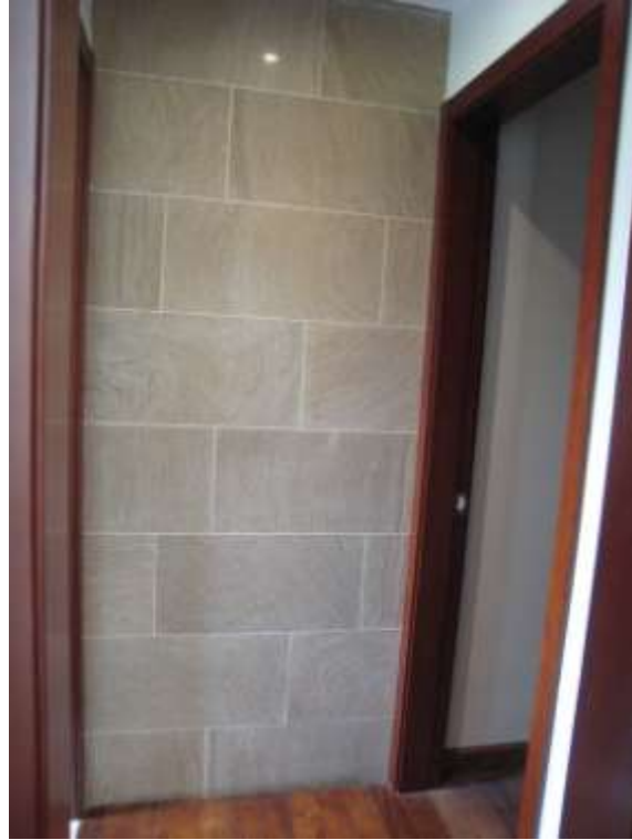
洗手浴室及衣帽間