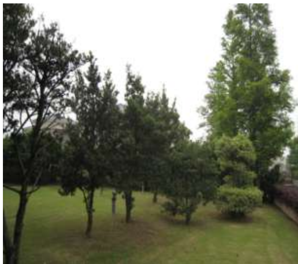
沿河向湖之綠化區