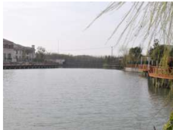
容積率為佘山別墅板塊·G50 交通方便區之最低: 中心湖一期 86 號屋岸觀看之一景