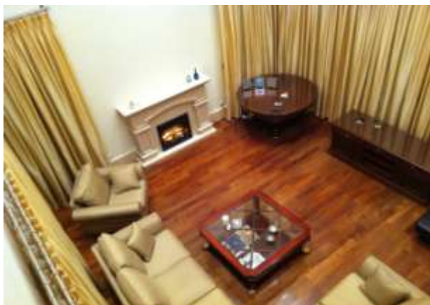
從樓上看大廳之一景