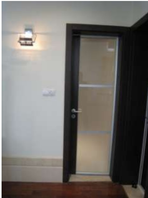
右車庫門, 前洗手間