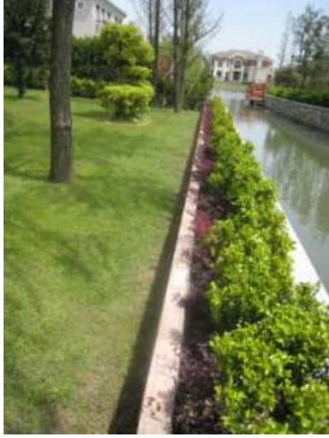
後花園沿河道綠化圍牆向湖之中心