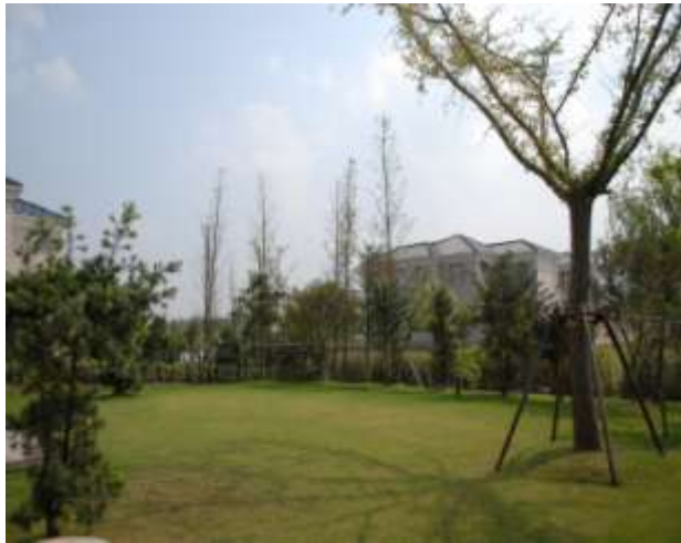
後園向東南湖邊一景